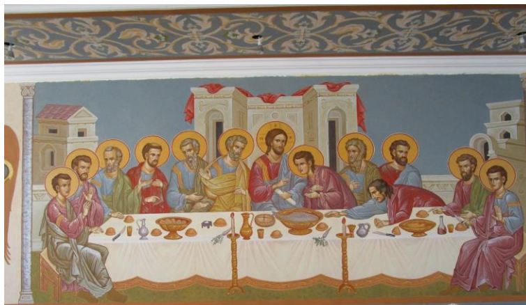
Рис. 1. Роспись трапезной Свято-Троицкого Никольского женского монастыря. Ташкент. 2018.

храмового пространства. При разработке колористического решения иконописцы берут во внимание не только особенности архитектуры, но вместе с тем и этнические, и географические особенности – сила света, тональность и т. п. Так, например, цветовая активность живописи была сознательно усилена Н. Шущалыковым в создании икон для иконостаса храма св. Николая Чудотворца в Бангкоке (Таиланд). Напротив, в ряде монументальных проектов в Узбекистане выбраны пастельные тона, что свидетельствуют о чутком и внимательном отношении художников к местным традициям.