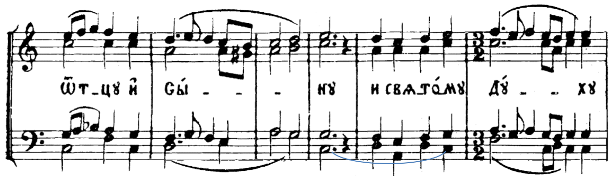
Рис. 2. «На литургии св. Василия Великого. Обиходная» [1, с. 28]

Этот яркий оборот, влекущий за собой смену ладового наклонения (минор – мажор), имеет широкое распространение в мелодике канонических церковных песнопений, реализуясь в басовой партии четырехголосной фактуры. Примеры тому можно встретить в православных богослужебных сборниках XIX–XXI веков (рис. 2) [1, 2].