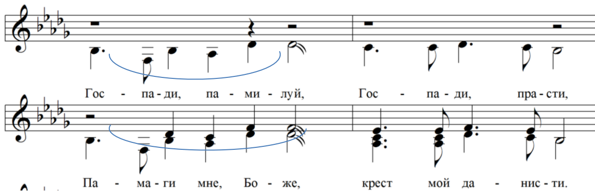
Рис. 1. «Господи, помилуй» (с. Орловка) [3]

Исследуемые духовные стихи сближаются с богослужебным пением еще по одному признаку – наличию в них рефрена «Трисвятое» и «Аллилуйя». Во многих напевах горнозаводских духовных стихов обнаруживает себя сходство начальных мелочеек. Основу этого типового мелодического оборота составляет квартовый элемент, зачастую образуемый из сцепления двух кварт: скачок от субкварты к тонике (IV–1) и от субсекунды к терцовому тону (II–3) (рис. 1).