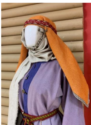
Рис. 1. Реконструкция комплекса украшений из могильника Киняминского II, п. 2 «а»

Комплексы украшений могильника Киняминский II, погребения 2«а» и 2«б» (рис. 1, 2) – это начальный этап в изучении и реконструкции украшений, найденных на территории Югры, которые войдут в проект «Звон священного металла» и послужат восстановлению и сохранению культурных традиций народов Западной Сибири.