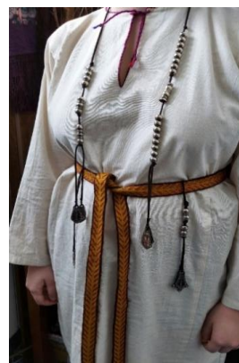
Рис. 2. Реконструкция комплекса украшений из могильника Киняминского II, п. 2 «б»