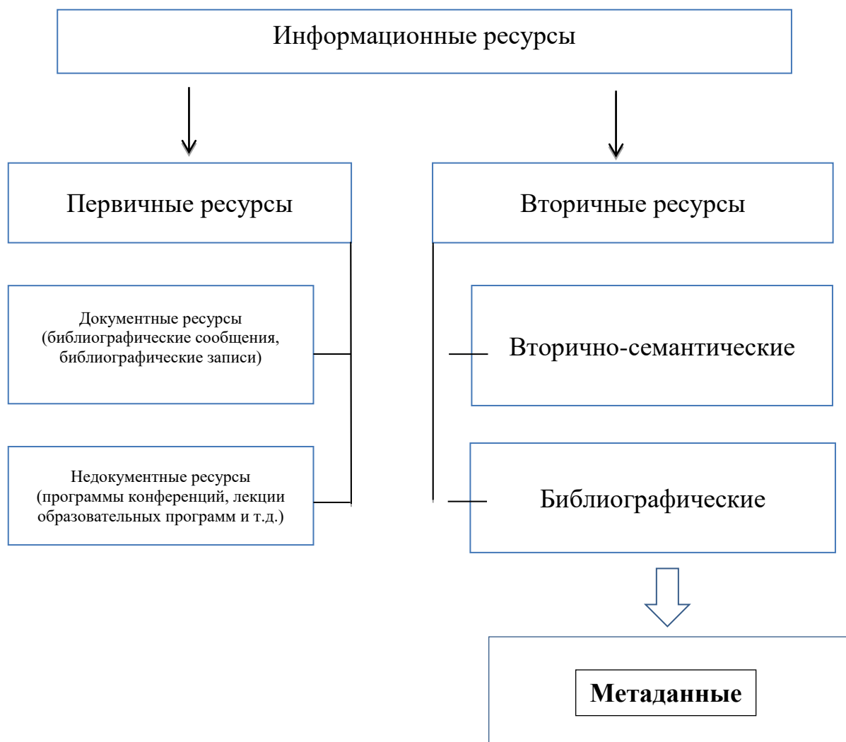
Рис. Дифференциация информационных ресурсов

4. Преимущества латентной библиографической информации становятся очевидны, когда они представляют собой скрытые ранее в литературе крупницы научно ценных сведений и могут оказаться весьма важными для другого специалиста. Латентная библиографическая информация занимает значительное место в современной системе информационных ресурсов. Важность и сложность освоения теории латентной библиографической информации во многом связана с тем, что научная разработка теоретических основ библиографии еще не завершена в полной мере. Разнообразие форм и жанров проявления метаданных способно расширить и дополнить систему налаживания коммуникаций ученых и специалистов.