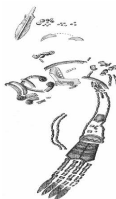
Рис. 1. «Kličevačkog Idol» (IV–III тыс. до н. э.).